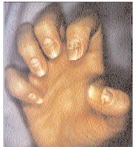
Fig.4 : Toxidermie à l'icodextrine. J25 Guérison en dehors des séquelles unguéales