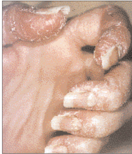
Fig.1 : Toxidermie à l'icodextrine. Atteintes des doigts et des ongles à J14