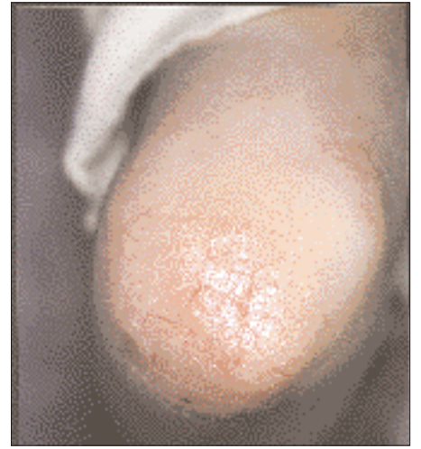
Fig. 2 : Toxidermie à l'icodextrine. Atteinte du coude gauche à J14